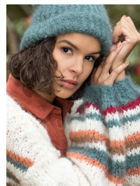
Se også CP05-09 ROSEWOOD FNUGG Agatgrønn 924, Rubinrød 923 Aprikos 911, Moskus 921, Natur 903