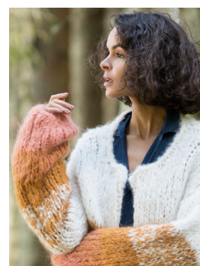
Se også CP05-18 CROCUS FNUGG Hvit 902, Moskus 921, Aprikos 911