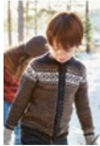
BLÅKOLLKOIA RAGLANKOFTE Sunday Design2