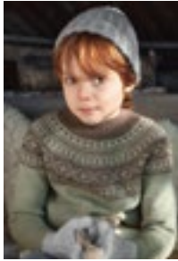
RUNDE GENSER Tynn merinoull Design1