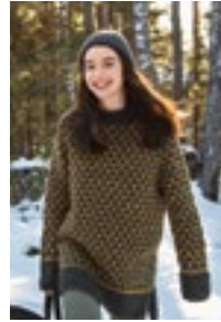
MOGEN RAGLANGENSER Fritidsgarn Design4