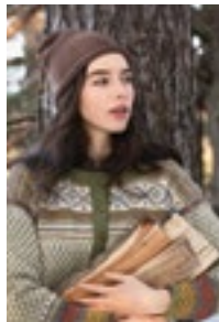
SNØHEIM KOFTE Mini alpakka Design8