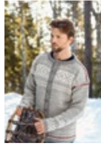
GJENDEBU KOFTE Peer gynt Design5