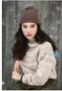
HAUKELISETER GENSER Mini alpakka Design3