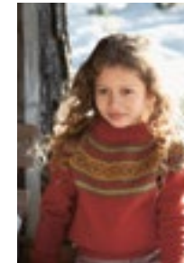
TROLLHEIMEN GENSER Babyull lanett Design10