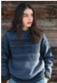
LYSEFJORDEN RAGLANGENSER Merinoull Design6