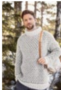
LYNGØR RAGLANGENSER Kos Design7